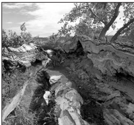
Lomany, padlý dub.