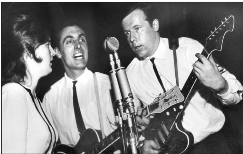
Orion Beat při koncertu.

Soubor dvakrát vyjel s delegací svazu mládeže do družebního města Erfurt v NDR. Mezi muzikanty však sílily rozpory o dalším hudebním