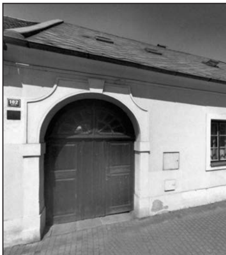
Manětín, čp. 102, dům rodiny Borovcovy.