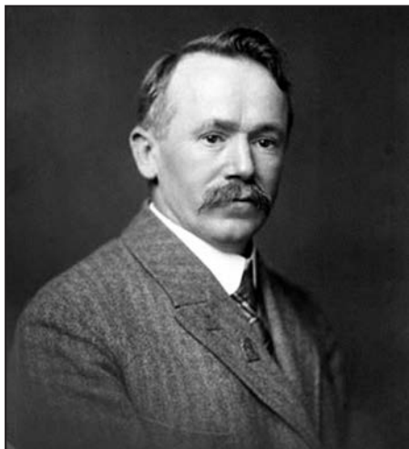
Vojtěch Beneš (1878–1951).

Vojta byl činný také literárně. Národní knihovna eviduje více jak stovku spisů z jeho pera. Mezi nimi najdeme jak práce politické a proklamační, tak i historické, čítanky