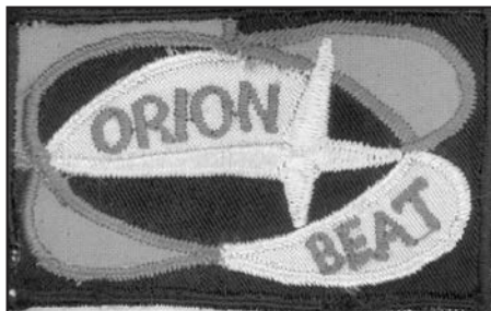
Nášivka skupiny Orion Beat.