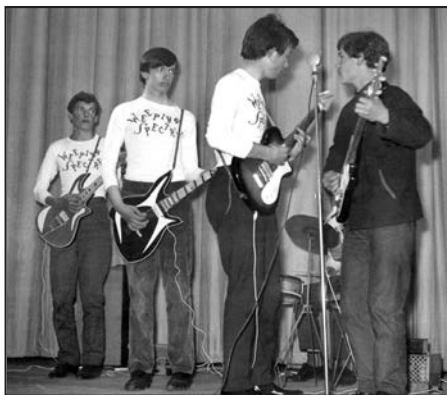
Weeping Spectres, 1964. (Řáha, Tarantík, Křemenák a Lang).

První skupiny vznikaly na okrese v roce 1964. Orion Beat v Kaznějově