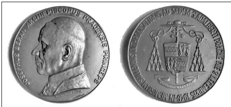
Medaile kardinála Josefa Berana.