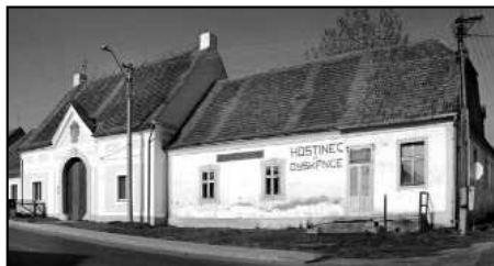
Dyškáňka. Současný stav.

Při dělení Gryspekových potomků roku 1589 se dokonce Sechutice, k nimž bylo připojeno několik okolních vesnic, staly načas samostatným statkem a sídlem Karla Gryspeka. Původně náležely Sechutice plaským cisterciákům, kteří se v letech 1592–1600 na Gryspecích neúspěšně dožadovali, aby klášteru vydali Sechutice (pivovar, krčmu, dvůr, ovčín a jiné budovy 3) ). Po pobělohorských konfiskacích získal Sechutice plaský klášter nazpět. 4) Za třicetileté války byl sechutický dvůr, kde byli ubytováni vojáci, zpustošen. Klášter po válce dvůr opravil, ale roku 1699 začal opat Ondřej Trojer stavět zcela nový ba-