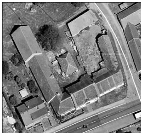
Hostinec Dyškánka, letecký pohled.

je spojení Dyškánky se Sechuticemi, což nahrává domněnce, že šlo původně o krčmu vystavěnou roku 1558, nebo alespoň o místo, kde tato krčma stávala.