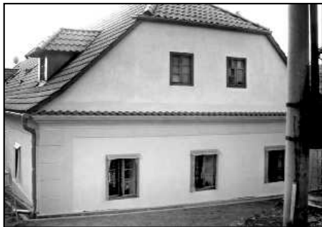
Objekt před rekonstrukcí (vlevo) a vedle opravená manětínská „Židovna“.

ný v děkanském archivu v Manětíně. V roce 1956 František Wonka napsal pojednání o některých významných manětínských židech 19. století. Rukopis je k dispozici v knihovně muzea v Mariánské Týnici. Pojednání napsal podle zpráv a jiných dokumentů vrchnostenského úřadu v Manětíně.