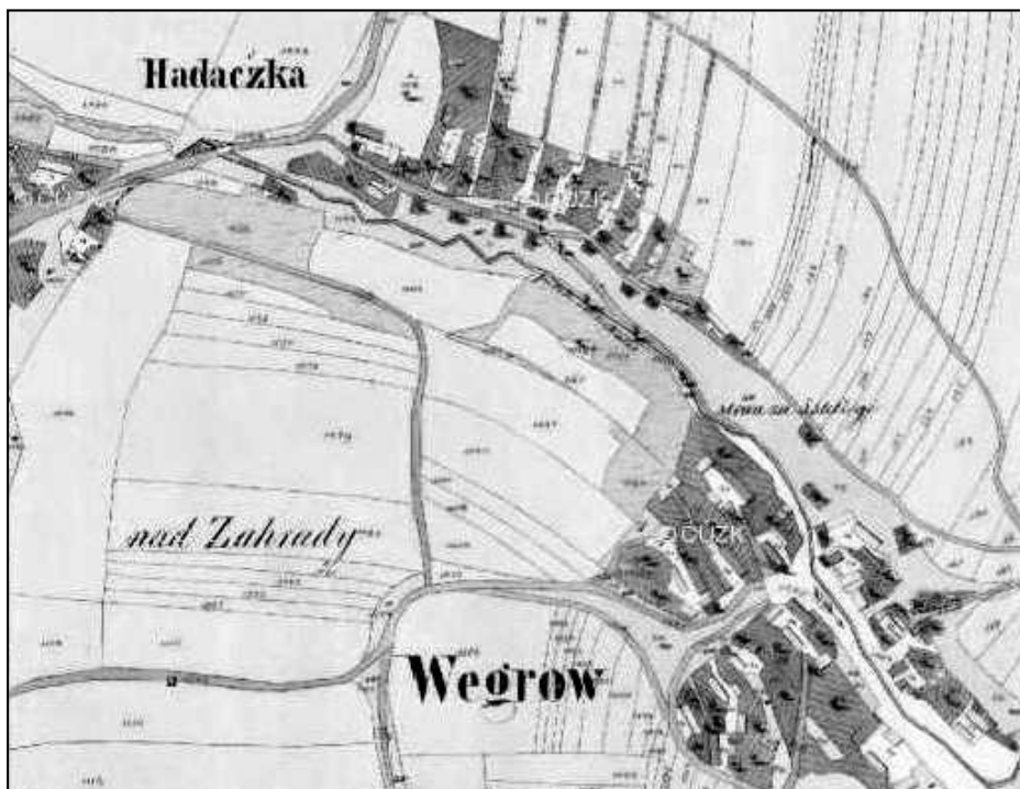
Situace roku 1839. Nejstarší část Hadačky a Výrov.

Na podporu svého tvrzení, že jméno nové vsi vzniklo z osobního jména Hadač, Kočka říká, že v Lito-