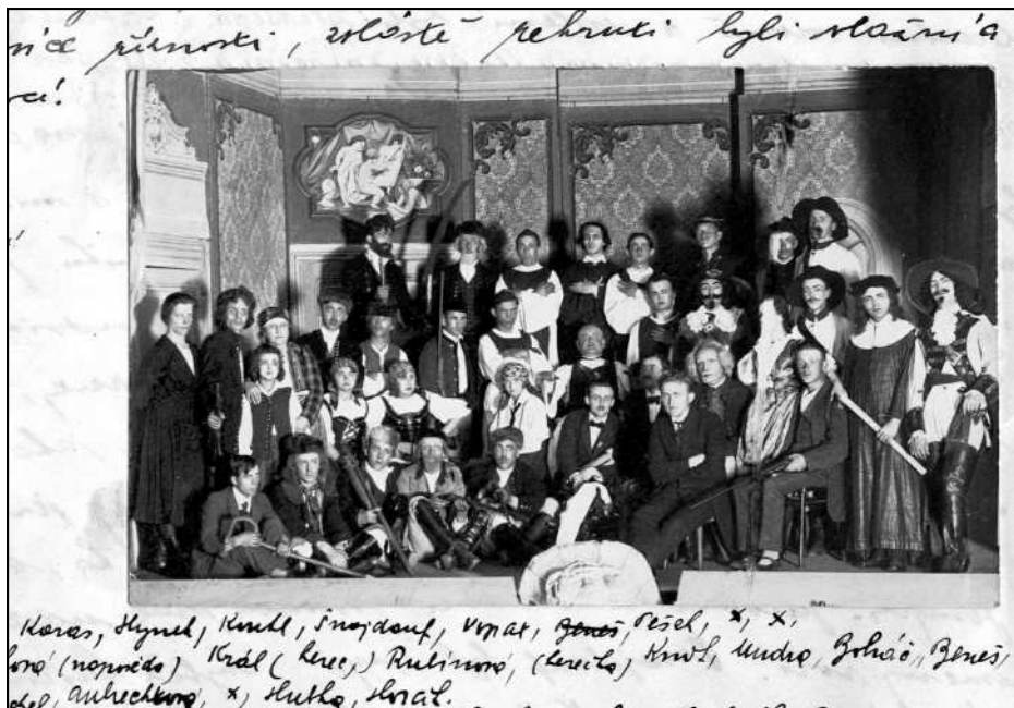
Soubor lidové scény v Kralovicích v roce 1923.