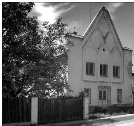
Čistá, Husova kaple.