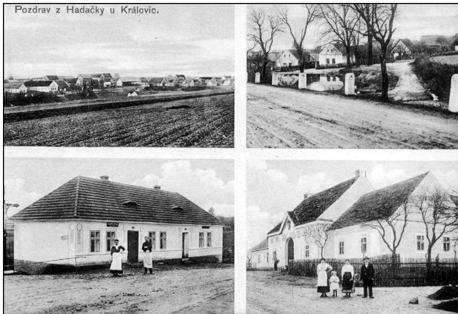
Dobová pohlednice „Pozdrav z Hadačky u Kralovic“ (foto archiv Muzea M. Týnice)

byly stavěny i při hlavní silnici a při cestě ke dvoru Sechutice. Blízkost Hadačky a Výrova činila potíže – v roce 1868 se za asistence advokátů řešil spor o náves v Hadačce se starousedlíky z Výrova. Samota Rouda pomístní jméno (čp. 15 a 16) byla v roce 1879 přidělena k obci Babina, na jejímž katastru ležela. 19)