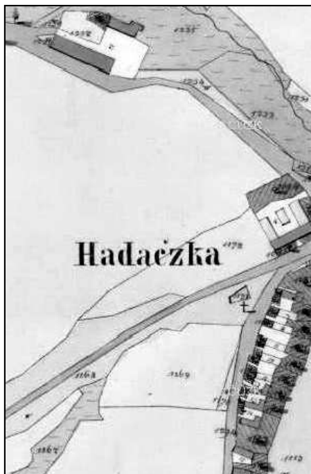
Situace roku 1839. Nahore ovčín, uprostřed hostinec Dyškánka, dole novější část Hadačky.