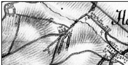
Situace v letech 1764-1768. Zleva: dvůr Sechutice, ovčín, hospoda Dyškánka, Hadačka, Výrov.