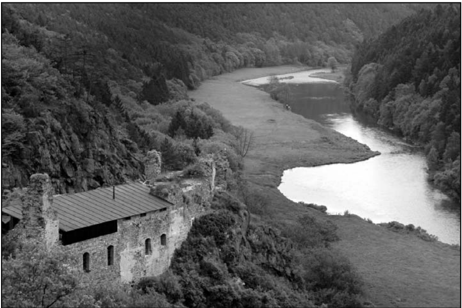
Řeka Berounka, vinoucí se údolím pod hradem Krašov.

ty největší z roku 1675, 1784, 1872, 1890 a i tu poslední z roku 2002. Dalším důvodem bylo i využití energetické, dopravní a zemědělské. Zájem o úpravu toku měla i města Plzeň, Beroun a Praha. V roce 1911 bylo