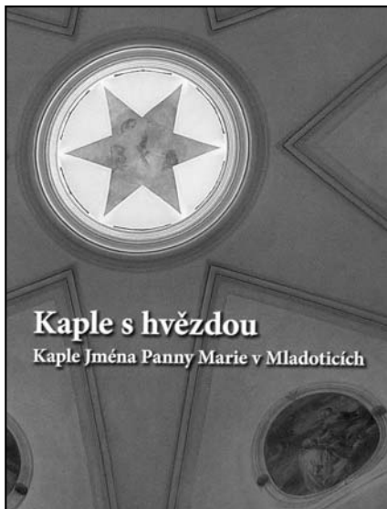
V roce 2010 vydal Nadační fond Mariánské Týnice, Muzeum a galerie severního Plzeňska v Mariánské