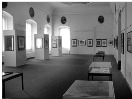
Instalace výstavy v refektáři muzea.