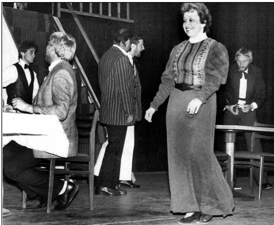
Představení „Teta z Bruselu“.

soubor uvedl také v Čisté, Žihli a na divadelním festivalu „Manětínská opona“. V roce 1990 kožlanští divadelníci uspořádali první divadelní ples.