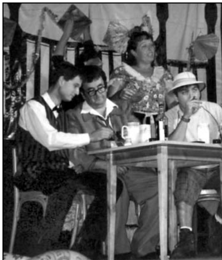
Soubor Hasiko na scéně.