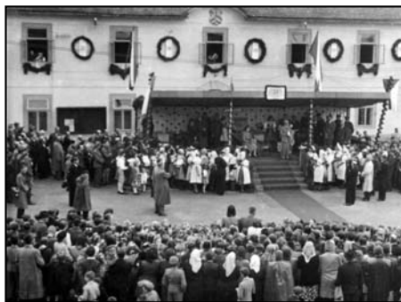
Návštěva prezidenta Dr. Edvarda Beneše v Kralovicích 18. května 1947.