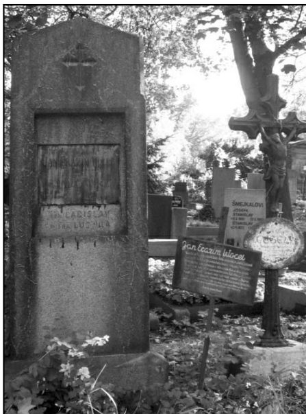
Hrob J. E. Vocela na Olšanských hřbitovech v Praze.