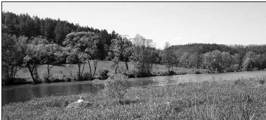
V bezprostřední blízkosti Berounky často hnízdí i labuť.

zahájeno zpracování studie, kterou zadala Obchodní a živnostenská komora v Praze. Studie předpokládala založit přehradní těleso u Čertovy skály na 70,5 říčním kilometru a u Nezabudic vybudovat vyrovnávací nádrž. Po kladném posouzení komorou byly zadány geologické, hydrologické a geodetické průzkumy. V roce 1914 bylo rozhodnuto, že přehrada bude u Křivoklátu na 63,2 říčním kilometru. Počítalo se též s úpravou toků Třemošenky a Střely. Hladina přehrady měla sahát až k Plzni a vše bylo v té době připraveno k realizaci. Přišla však 1. světová válka a veškeré práce byly zastaveny. Znovu se uvažovalo o výstavbě přehrady ve 40. letech a navíc měl být vybudován průplav mezi Plzní a Řeznem. 2. světová válka však tyto záměry opět přerušila.