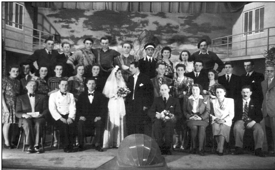
Opereta „U veselého kamzíka“ uvedená v roce 1946.