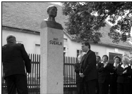
Slavnostní odhalení pomníku Antonína Švehly v Hodyni dne 2. 7. 2011.