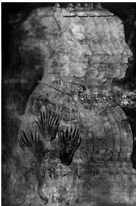
Jiří Anderle: Dáma ve žlutém, 1976–78, suchá jehla.

Existencialismus, nitěrná zákoutí, osobité interpretace historických událostí, reakce na epochy z dějin umění, zátiší, krajiny, příběhy z cest nebo obrazy vytvořené jen tak pro radost vlastní i druhých se prolínají rozměrnými i komornými grafickými listy. Jejich tvůrci pracovali prostřednictvím leptu, mezzotinty, akvatinty, litografie