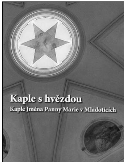
V roce 2010 vydal Nadační fond Mariánské Týnice, Muzeum a galerie severního Plzeňska v Mariánské

Týnici a obec Mladotice za podpory Plzeňského kraje ke 300. výročí vysvěcení kaple Jména Panny Marie v Mladoticích.