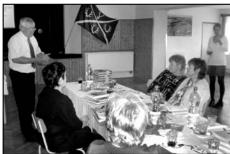
Setkání kronikářů v Nekmří, 21. října 2010.

Každá obec by měla vést kroniku, do které by se zaznamenávaly zprávy