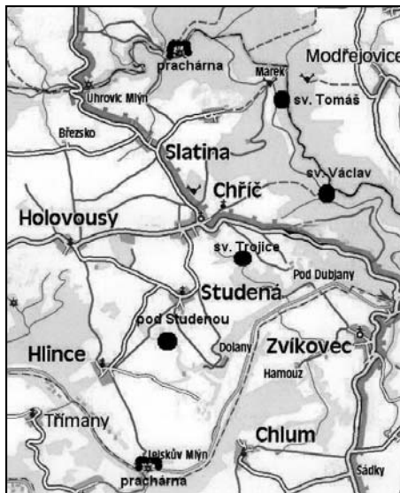
Chemické závody na Chříčsku v 19. století a prachárny v 18. století.