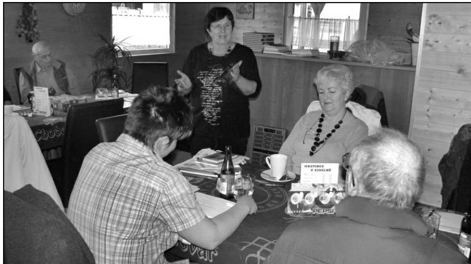
Setkání kronikářů ve Zbůchu 25. října 2010 .

došlo k výměně kronikářů. Muzeum a galerie severního Plzeňska v Mariánské Týnici připravuje pro kronikáře pravidelně jedenkrát za dva roky celookresní aktiv a v mezidobí malé střediskové aktivity. V letošním roce to bylo v Nekmíři a Zbůchu, kam byli pozváni i kronikáři z mikroregionu Radbuza. V prvním čtvrtletí příštího roku připravuje muzeum aktivity v Kaceřově, Přehýšově a ve Zruči. Na požádání obecních i městských úřadů je poskytována i individuální metodická pomoc začínajícím kronikářům. V mnoha obcích převažuje ručně psaná kronika, začínají se objevovat