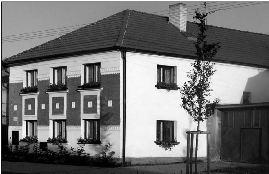
Dům u Pelnářů čp. 150 (současný stav) kde ordinovali první kožlanští lékaři.

v místech bývalé Občanské záložny, kde má rovněž ordinaci a provádí lékařskou praxi včetně prací zubolékařských. Jako městský lékař pobírá od města služné ve výši 10 000 Kč ročně a deputát palivového dřeva, které je mu zvýšeno ještě o 2 m 3 celkem tedy na 7 m 3 paliva. Současně však je ještě jmenován nemocenským lékařem Okresní nemocenské pojišťovny v Kralovicích, která má v té době již 14 lékařů (kdy na jednoho lékaře připadá v průměru již 350 pojištěnců), neboť v té době byl již přijat Čs. Zákon o Léčebním fondu, kde vláda stanovuje minimální a maximální hranici příspěvku do tohoto fondu a to od 8 do 25 Kč měsíčně pro chudé, státní a veřejné zaměstnance. Dr. Štverák jako první v Kožlanech zakládá v roce 1921 Čs. Červený kříž, který za pomoci a předsednictví sta-