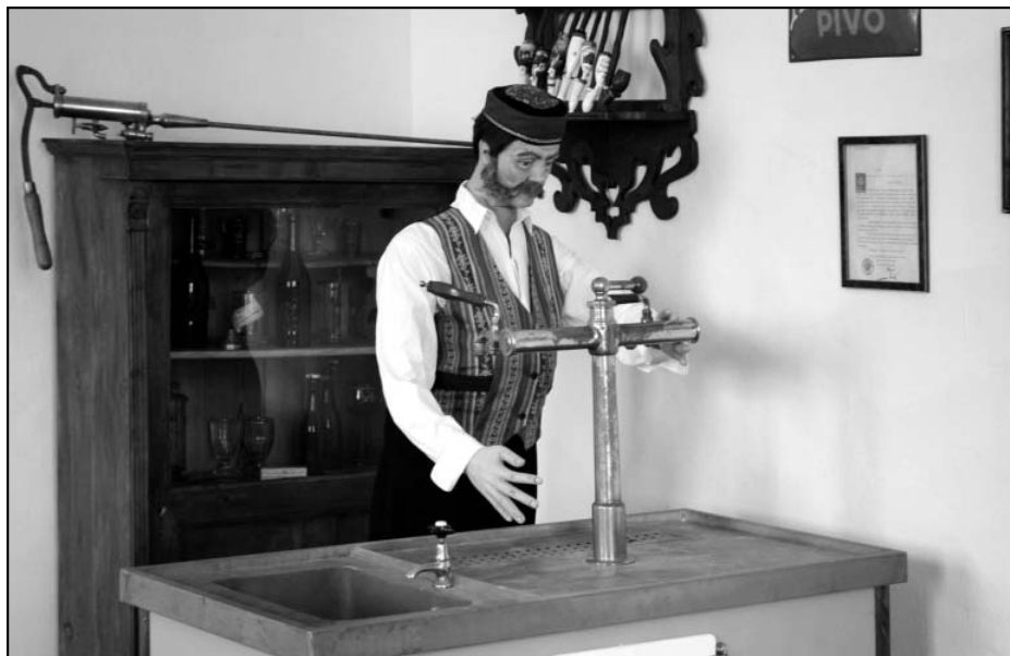
Pohled do části nové expozice muzea - staré hospody.

Výstavy byly připraveny i mimo muzeum, a to především pro Plasy, kde u příležitosti výročí Antonína Wiehla (1846–1910), plaského rodáka, byla v prostorách konventu představena jeho tvorba architektonická, činnost památkářská i organizační. Pokračování výstavy se odehrává v Praze na stavební fakultě ČVUT. Wiehlovi byla věnována též konference uspořádaná v Plasích a v Praze. Druhá výstava muzea byla připravena v rámci projektu „Vergessenes Erbe“ pro Centrum Bavaria Bohemia v Schönsee. V říjnu 2010 představila zapomenuté německé výtvarné umělce ze západních Čech.