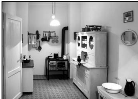
Stará kuchyně v expozici muzea.

2010", věnovanou současné tvorbě regionu, již se účastnilo 41 amatérských i profesionálních výtvarníků, pro něž je setkání jednou za pět let významnou možností konfrontace dosažených výsledků i vzájemné komunikace. Vedle těchto výtvarných výstav vzbudila pozornost národopisná tematika, již představila výstava věnovaná veselým okamžikům lidského života - křtinám a svatbám. Připomněla zvyky a obřady, které doprovázely na severním Plzeňsku tento významný krok v 19. a ve 20. století a mnohé z nich přetrvávají dodnes. Publikace k tomuto tématu bude vydána příští rok a doplní tak řadu ročního zvykoslovného cyklu o další regionální dokumentaci.